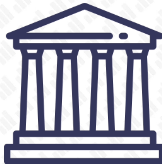
Partenón de Atenas

En los mercados financieros la bola de cristal no existe y por ello nuestro trabajo consiste en gestionar dicha incertidumbre en busca de un retorno atractivo en función del riesgo asumido.